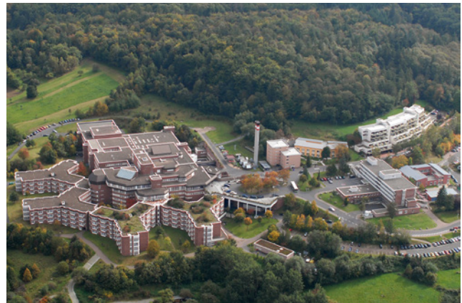
Aschaffenburg-Alzenau: Luftbild Standort Aschaffenburg

Am Standort Alzenau, dem ehemaligen Kreiskrankenhaus Alzenau-Wasserlos, befinden sich vier medizinische Abteilungen und die Geriatrische Reha, zudem Kooperationen mit niedergelassenen Fachärzten.